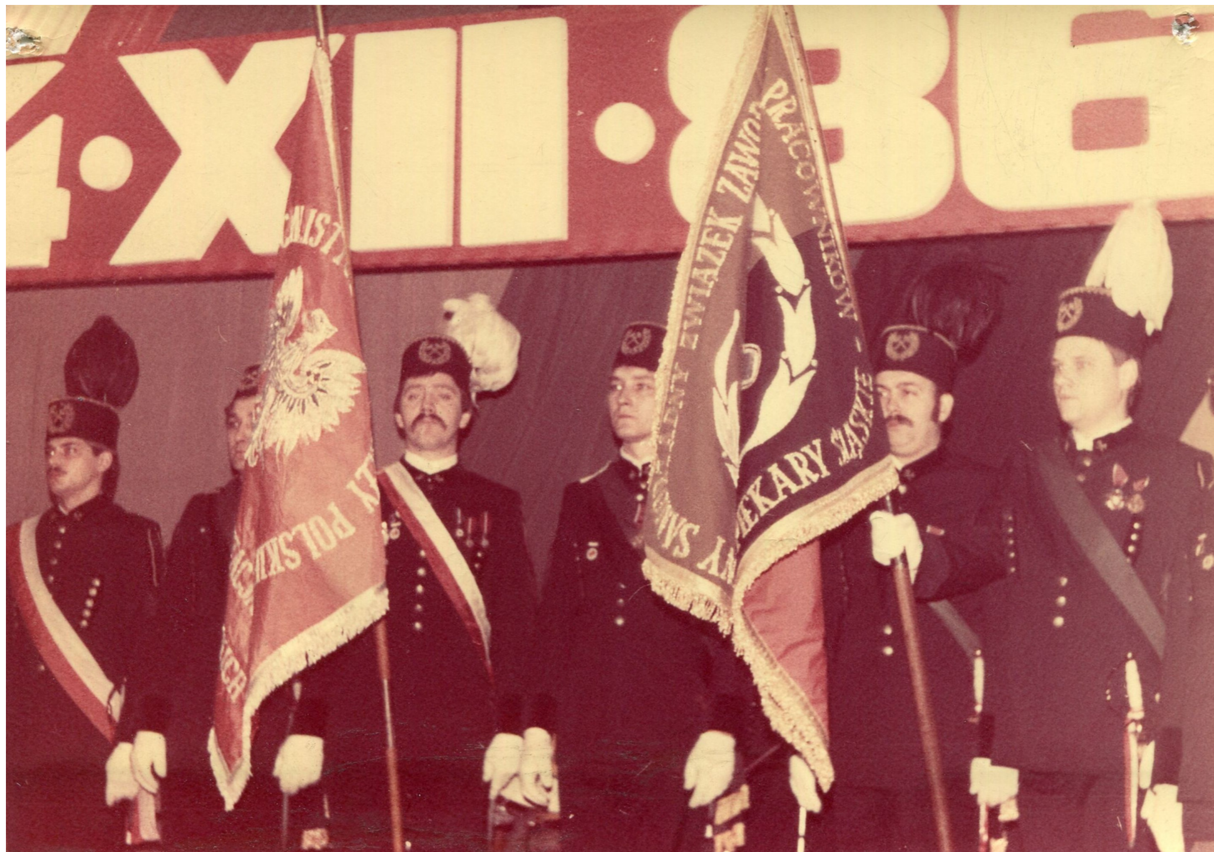
Uroczystości barbórkowe w 1986 r. w KWK "Julian" w Piekarach Śląskich