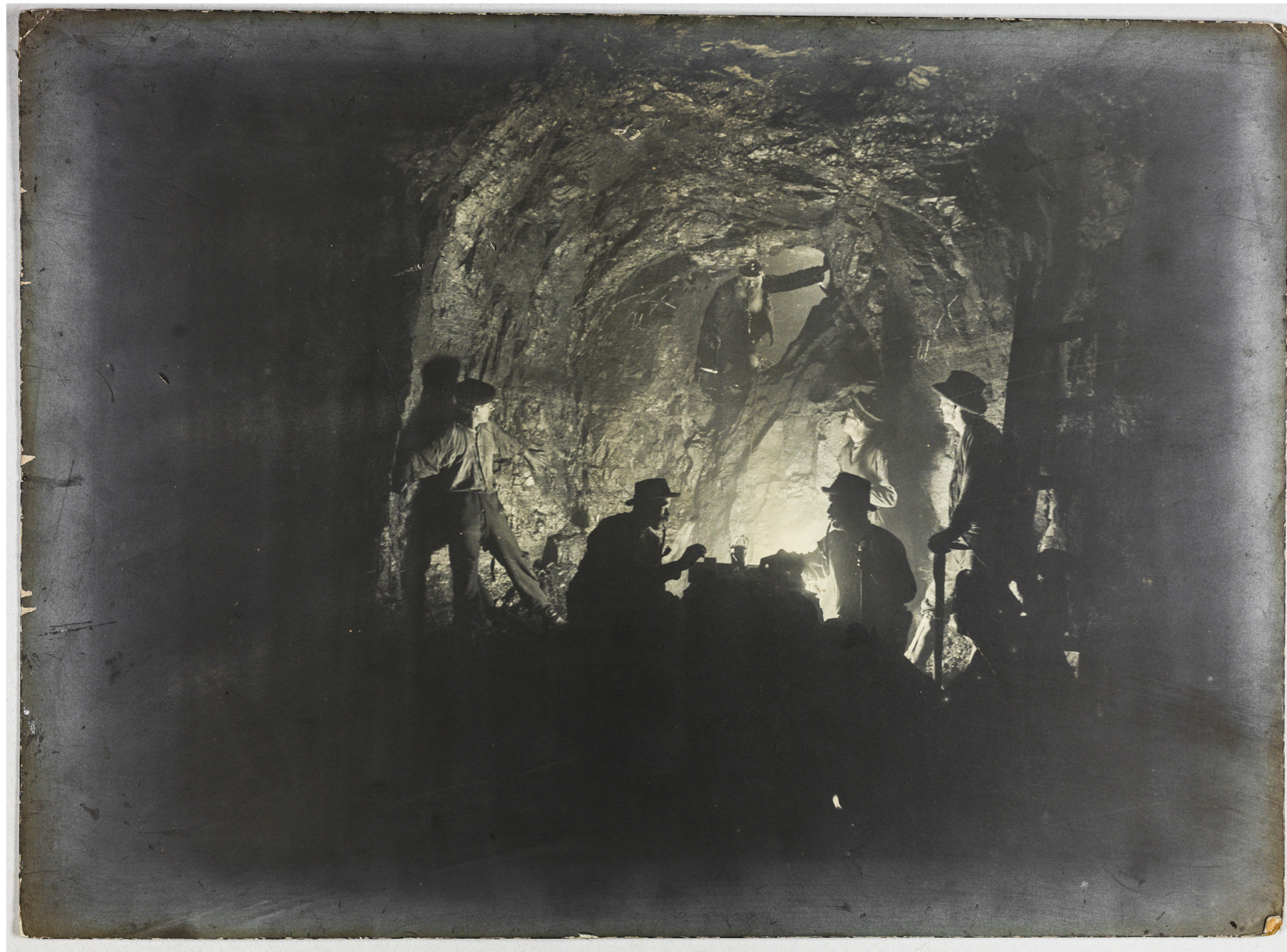
Skarbnik ukazujący się górnikom