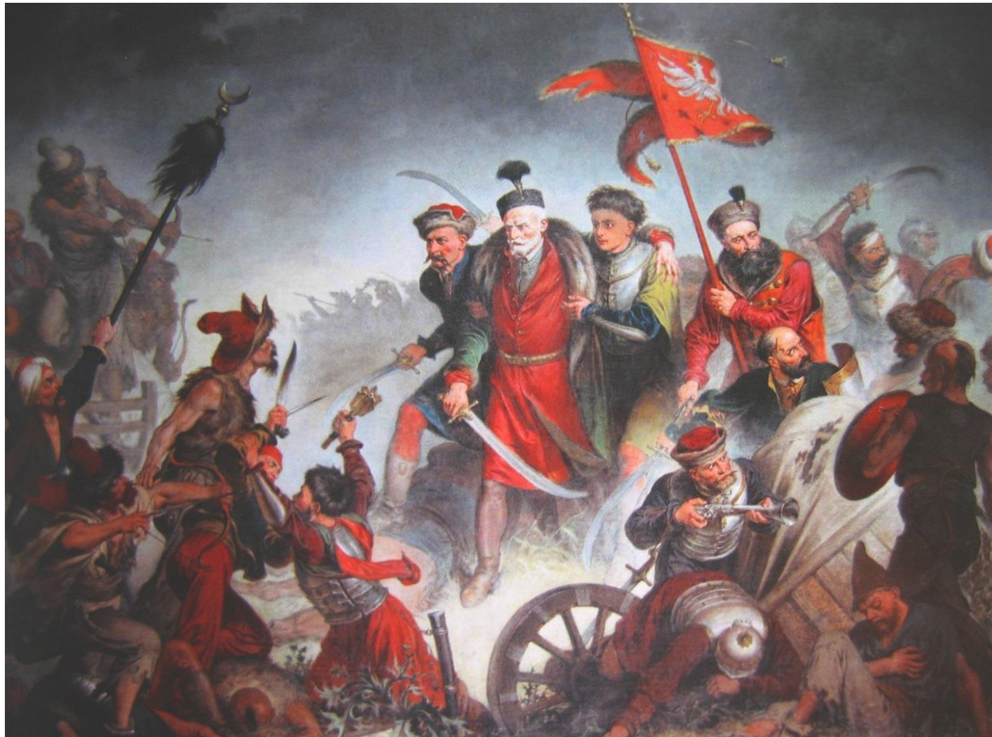
Obraz Walerego Eljasza Radzikowskiego

Źródło: Walery Eljasz Radzikowski; domena publiczna;