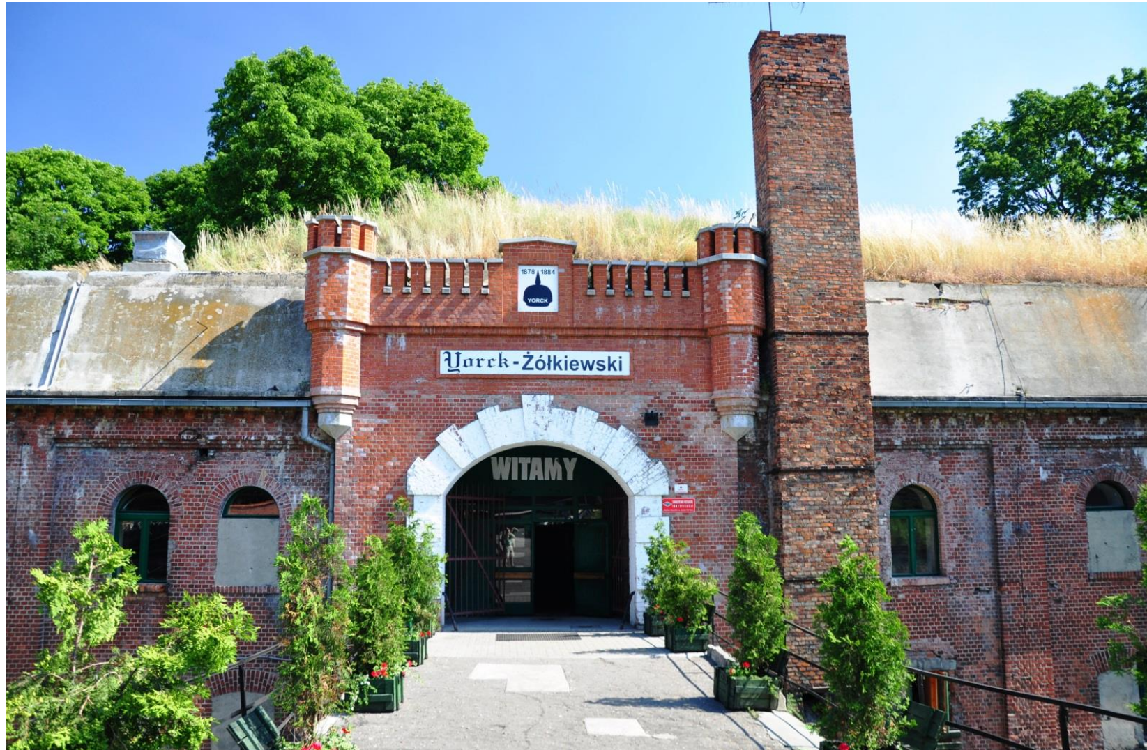
Fort IV im. Żółkiewskiego w Toruniu