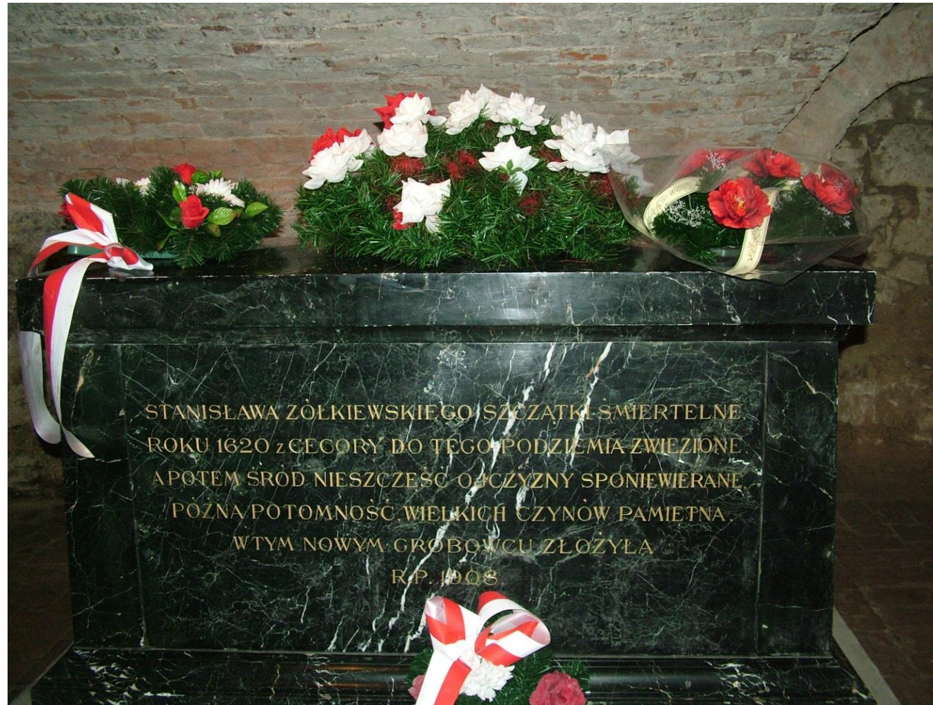
Sarkofag Hetmana Stanisława Żółkiewskiego w Żółkwi