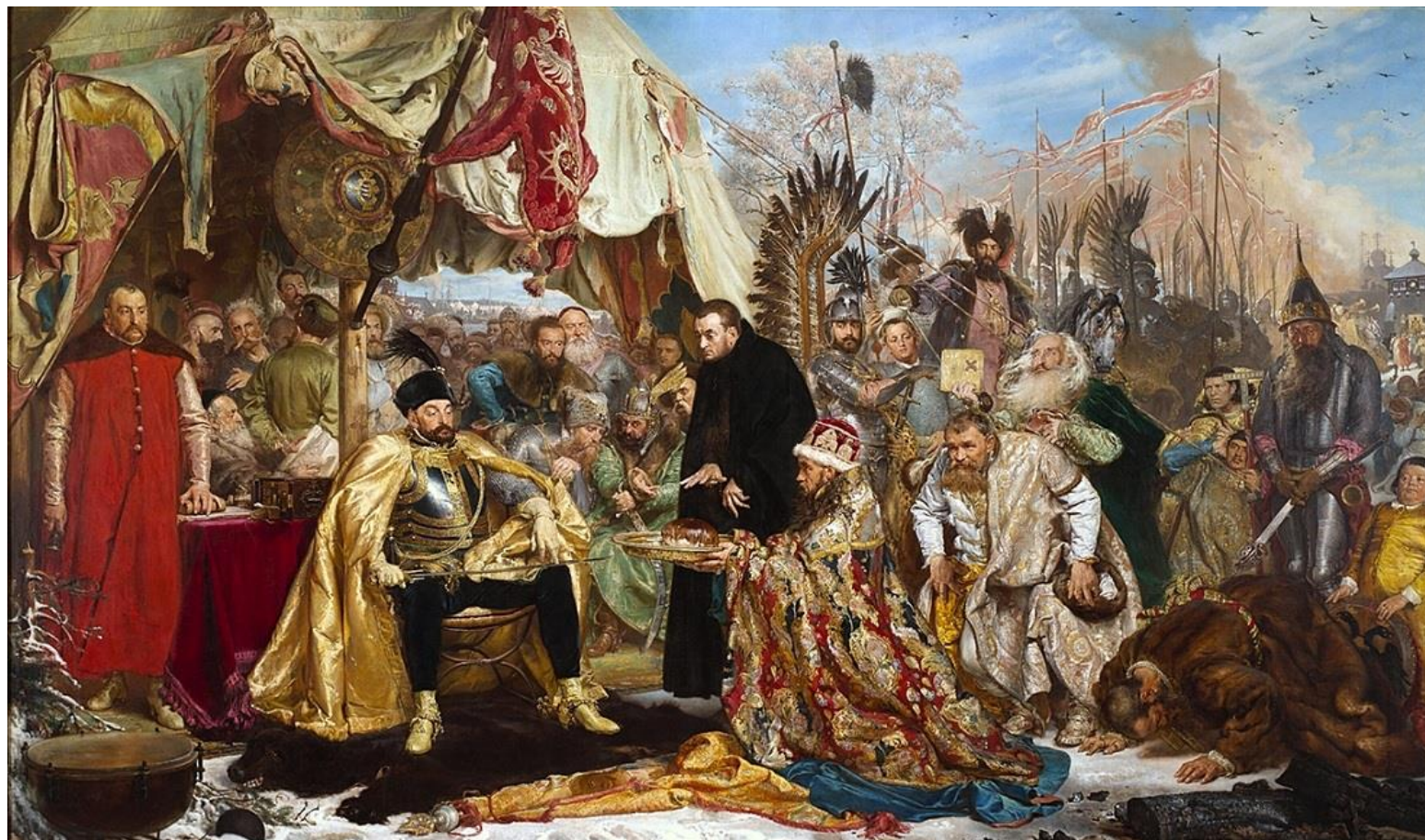
Obraz Jana Matejki „Batory pod Pskowem”

Źródło: Matejko Jan, domena publiczna; https://commons.wikimedia.org/wiki/File:Jan_Matejko-Batory_pod_Pskowem.jpg (dostęp: 1.04.2020).