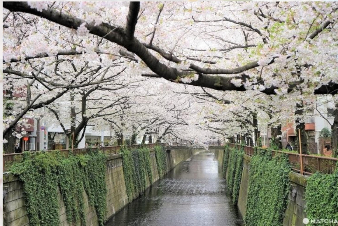
https://matcha-jp.com/en/9621?type=news - Sakura In Tokyo 2020 - Meguro River (dostęp: 21.04.2020)

Wzdłuż rzeki znajduje się także wiele kawiarni i restauracji, a niektóre z nich dysponują miejscami do siedzenia na tarasie, na których można delektować się pysznymi potrawami z widokiem na wiśniowe kwiaty. Kwiaty wiśni nad rzeką Meguro można podziwiać w dzień i w nocy.