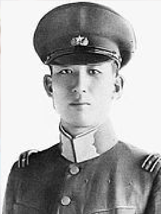
Odznaka na czapkę dla oficerów dywizji Gwardii Armii z „Sakurą” wokół pięcioramiennej gwiazdy.