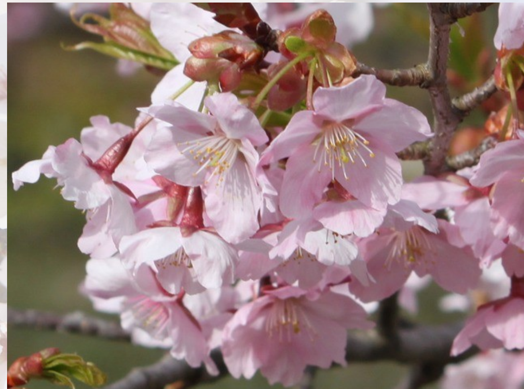
https://www.flower-db.com/en/flower:2136 - Shuzenzi-kan-zakura, Kyoto Botanical Garden, kanzakura – (dostęp: 14.04.2020)