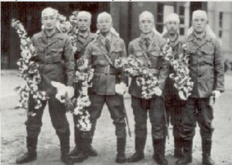
https://fareastfling.me/2015/02/21/cherry-baka-bombs-sakura-japan/ - Cherry Bombs: The Darker Side of Sakura in Japan – (dostęp: 21.04.2020)

Japońscy piloci kamikaze malowali sakurę na bokach swoich samolotów, przed wylotem na samobójcze misje, a nawet zabierali ze sobą gałązki tych drzew. Rząd propagował wiarę w to, że dusze poległych wojowników odrodzą się w kwiatach.