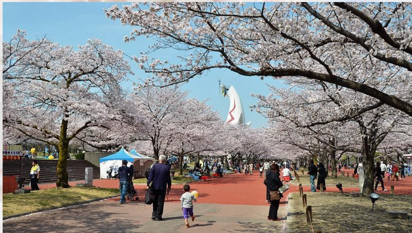
https://www.japan-guide.com/e/e4029.html - Osaka Expo '70 Park Ogromny, pamiątkowy park publiczny na dawnym terenie Expo 70 (dostęp: 21.04.2020)

To bardzo duży, publiczny park w Osace. Tu w 1970 r. na rozległym terenie odbyła się Japońska Wystawa Światowa, pierwsza tego rodzaju w Azji, która wystawiła ponad 75 pawilonów, aby pochwalić się cudami krajów świata i najnowocześniejszych korporacji. Po zakończeniu World Expo tereny zostały przekształcone w Park Pamiątkowy Expo i udostępnione publiczności. Wielkie pawilony ustąpiły miejsca nowo zasadzonym lasom, ogrodom oraz szerokim trawnikom i placom wyłożonym kwitnącymi roślinami i drzewami. Około 5000 drzew wiśniowych zasiedla tereny, szczególnie wzdłuż południowo-wschodnich placów, które zamieniają park w jedno z najpopularniejszych miejsc kwitnących wiśni w Osace.