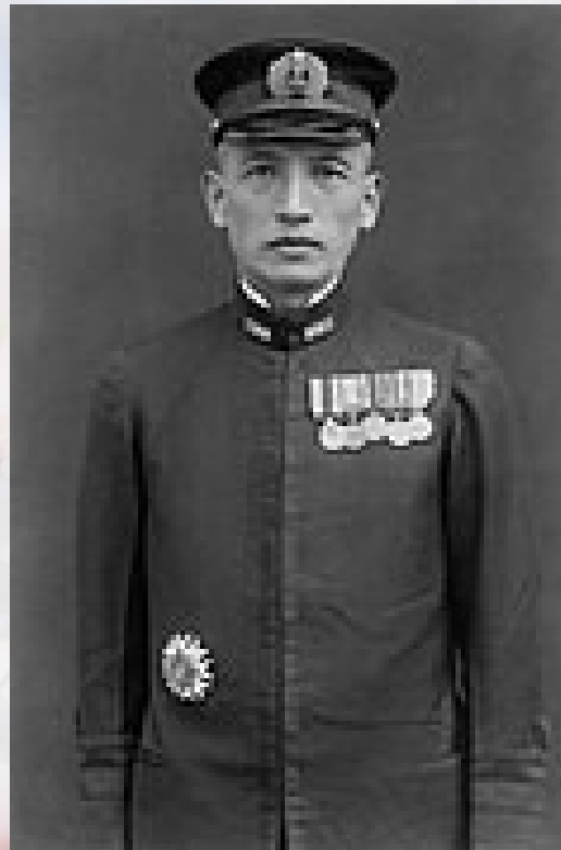
Odznaka czapki oficera marynarki z „wiśniowym drzewem” i „liściem sakury” na kotwicach itp.