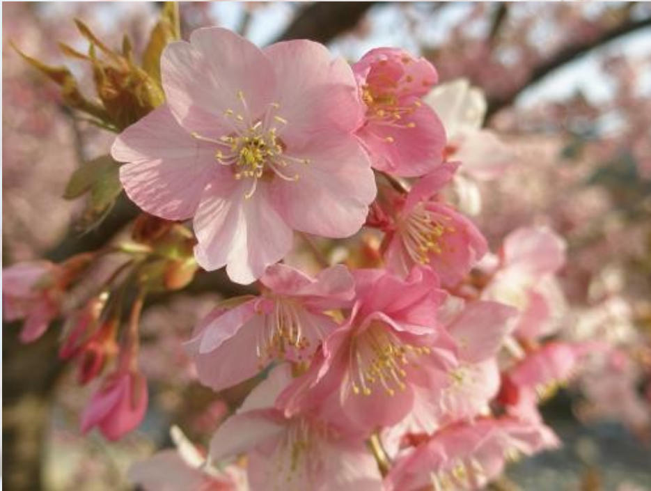
Close-up of Kawazu-zakura cherry trees, kawazuzakura – (dostęp: 14.04.2020)

Kanzakura jest jedną z pierwszych kwitnących wiśni. Występuje tylko w stosunkowo niewielkiej liczbie w niektórych parkach miejskich, gdzie zaskakuje i zachwyca odwiedzających swoim wczesnym kwitnieniem.