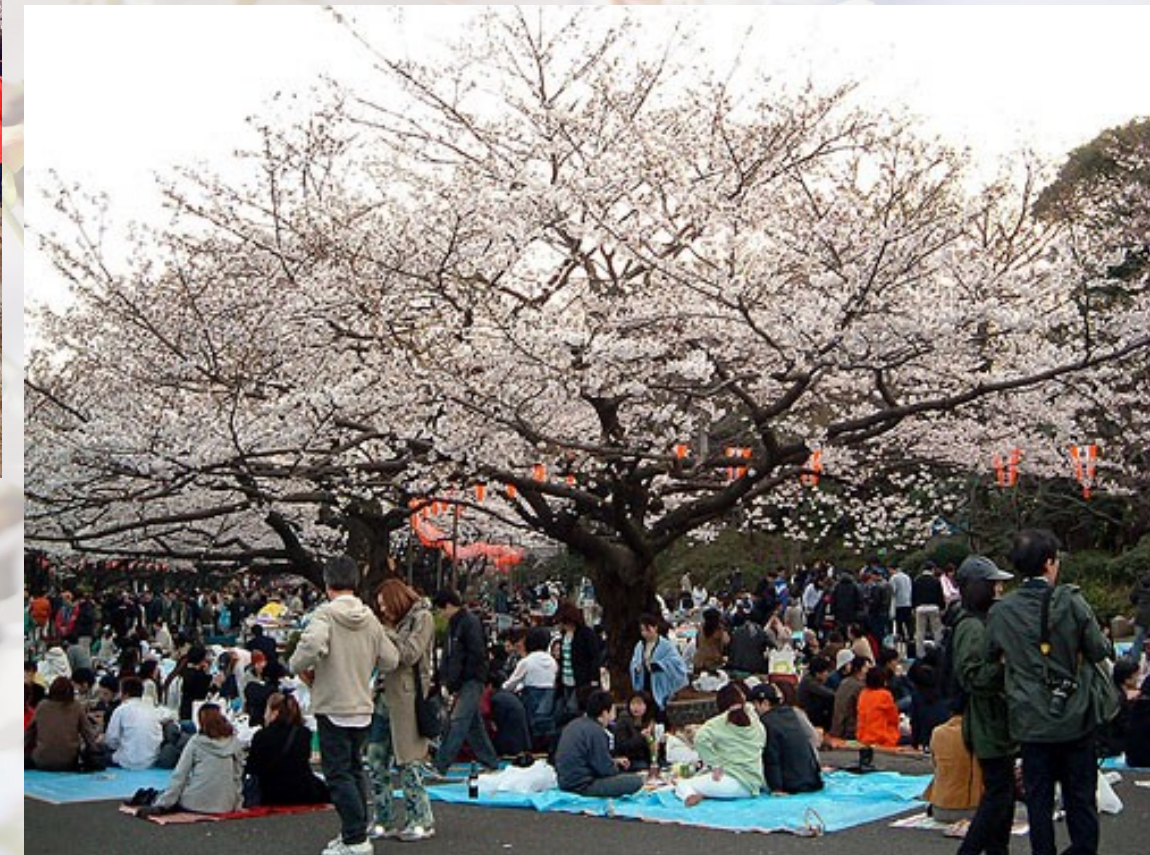
http://ammo.jp/monthly/0503/03.html - Gwar w górach Ueno, znane miejsce do oglądania kwiatów wiśni. (dostęp: 21.04.2020)