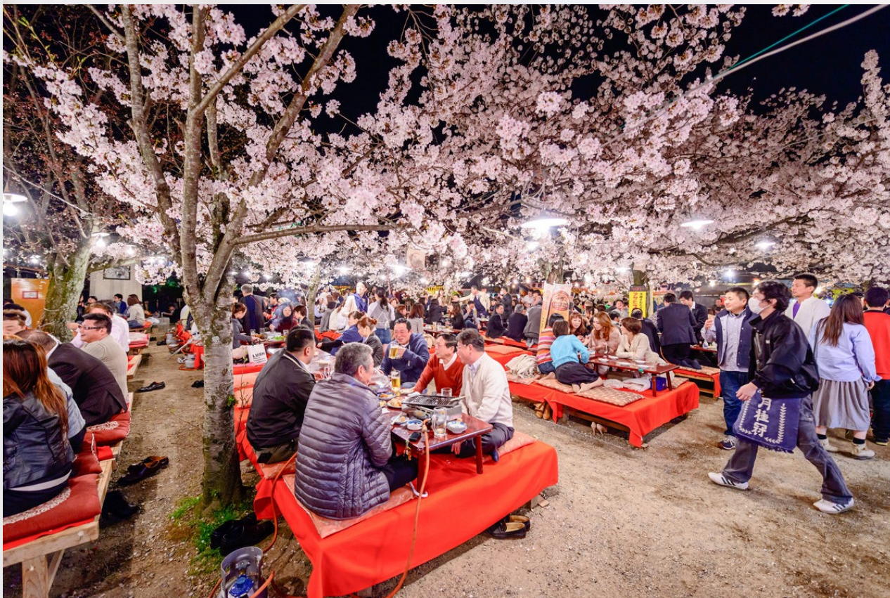
https://omatsurijapan.com/blog/kyoto-ohanami10-2019/ - Omatsuri Japan, 10 miejsc do oglądania kwiatów wiśni w Kioto (dostęp: 22.04.2020)