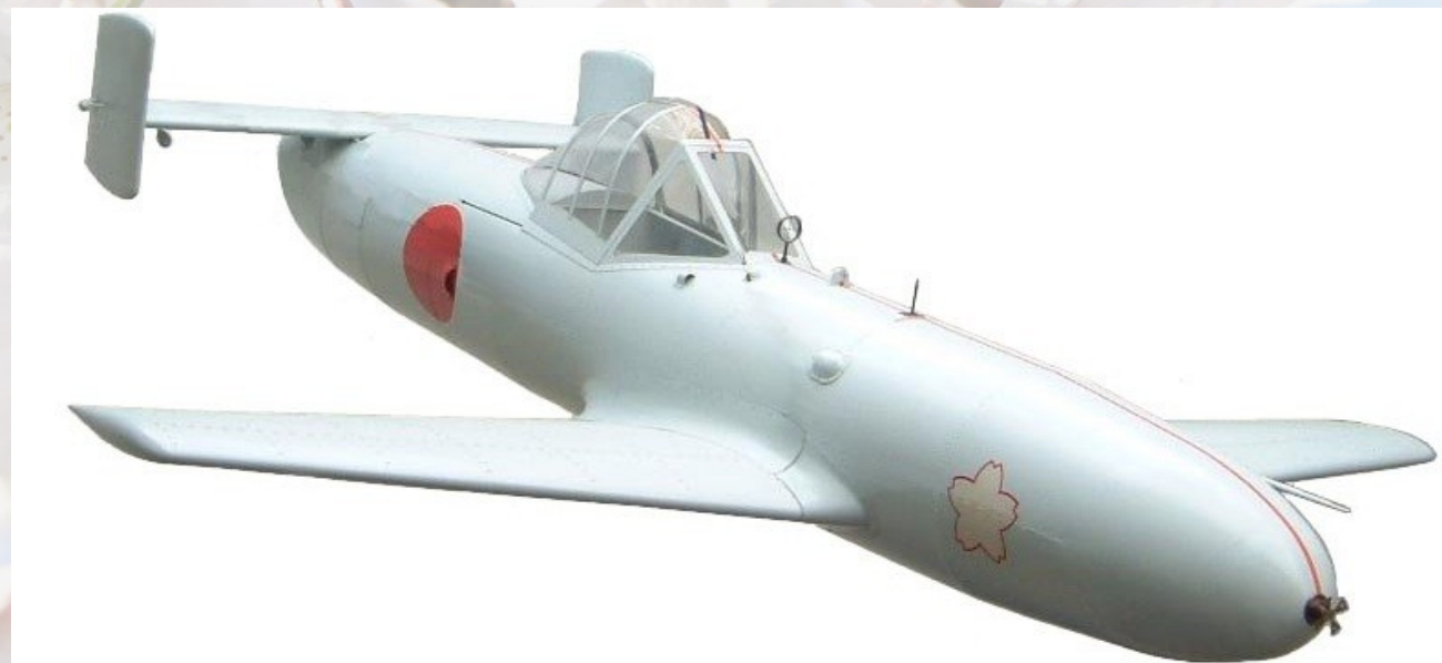
https://fareastfling.me/2015/02/21/cherry-baka-bombs-sakura-japan/ - Cherry Bombs: The Darker Side of Sakura in Japan – (dostęp: 21.04.2020)