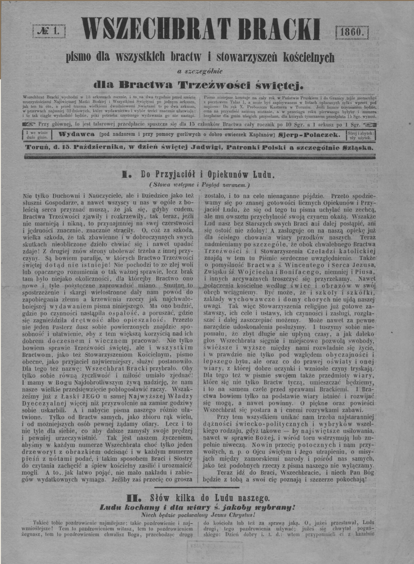
Fot. A. Młodzik

Źródło: S. Kalembka, Julian Prejs-Sierp Polaczek (1820-1904) , [w:] Wybitni ludzie dawnego Torunia , pod red. M. Biskupa, Warszawa-Poznań-Toruń 1982, s. 200.