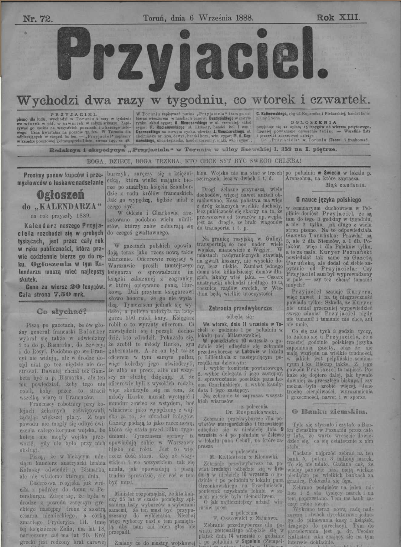
Fot. A. Młodzik

Źródło: T. Zakrzewski, Ignacy Danielewski (1829-1907) , [w:] Wybitni ludzie dawnego Torunia , pod red. M. Biskupa, Warszawa-Poznań-Toruń 1982, s. 222-223.