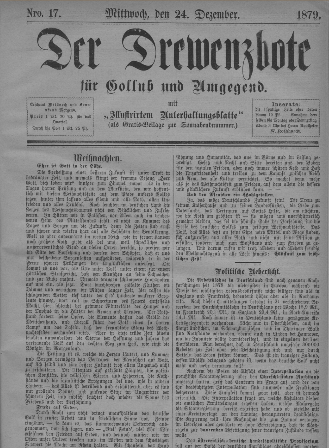
Fot. A. Młodzik

Źródło: E. Lambeck, R. Hupfer, Einladung zum Abonnement , „Der Drewenzbote für Gollub und Umgegend”, Nro. 1 (1879), s. 1.