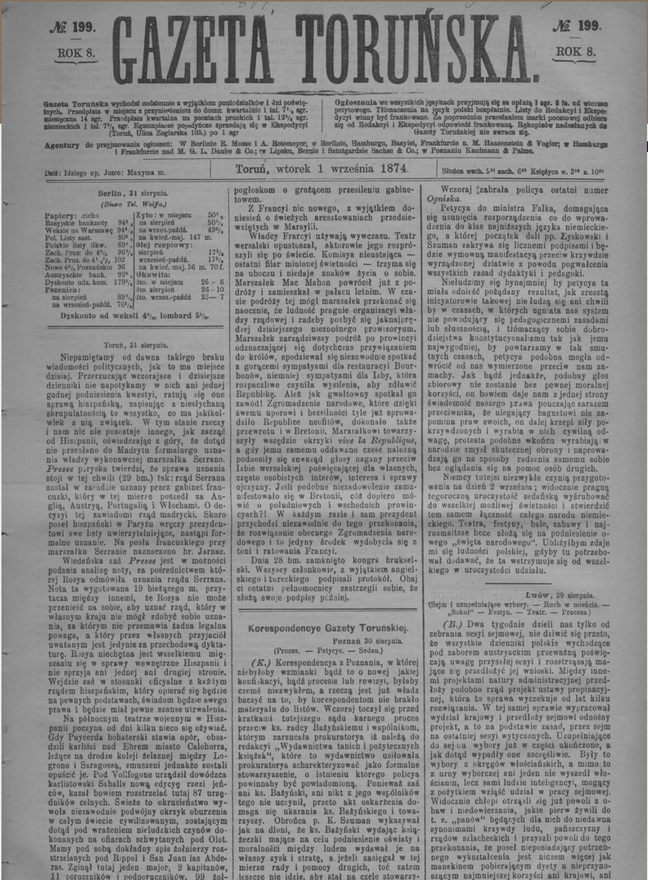
Fot. A. Młodzik

Źródło: S. Wierzchosławski, Franciszek Rakowicz (1839-1878) , [w:] Wybitni ludzie dawnego Torunia , pod red. M. Biskupa, Warszawa-Poznań-Toruń 1982, s. 227-228.