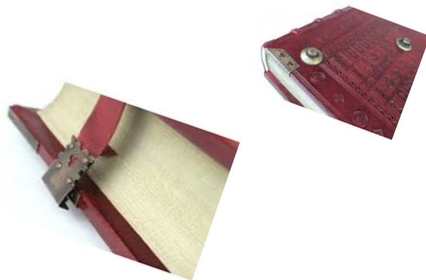
Faksymile Biblii Jana Gutenberga za zbiorów Książnicy Kopernikańskiej.