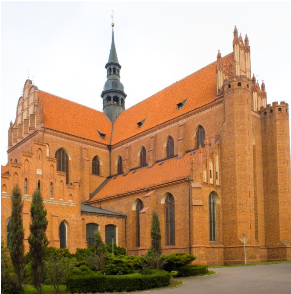
Opactwo pocysterskie w Pelplinie.

http://tpzp.diecezja-pelplin.pl/index.php/2015/09/18/katedra/