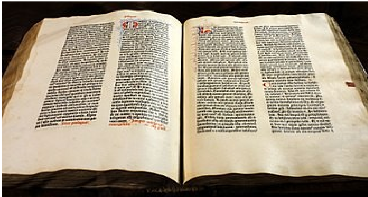
Biblia ze zbioru Muzeum Diecezjalnego w Pelplinie