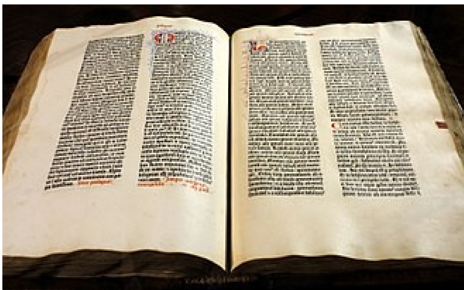
Biblia ze zbioru Muzeum Diecezjalnego w Pelplinie

Biblia Gutenberga jest kompletnym wydaniem Pisma Świętego. Zawiera łacińskie tłumaczenie św. Hieronima wraz z jego komentarzami i prologiem. Całość obejmuje 2 tomy.