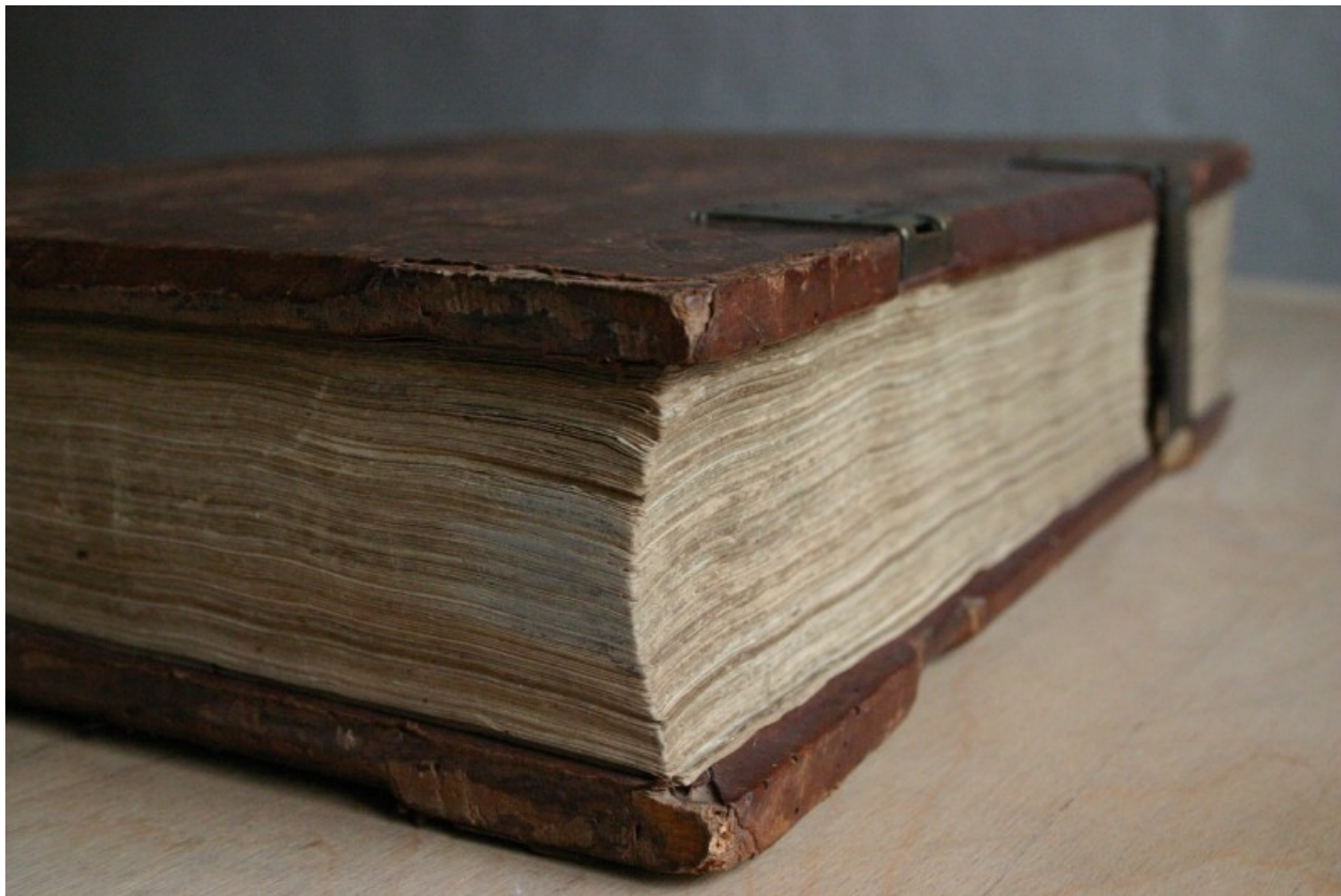
Biblia ze zbioru Muzeum Diecezjalnego w Pelplinie

https://pixabay.com/pl/images/search/biblia%20gutenberga/