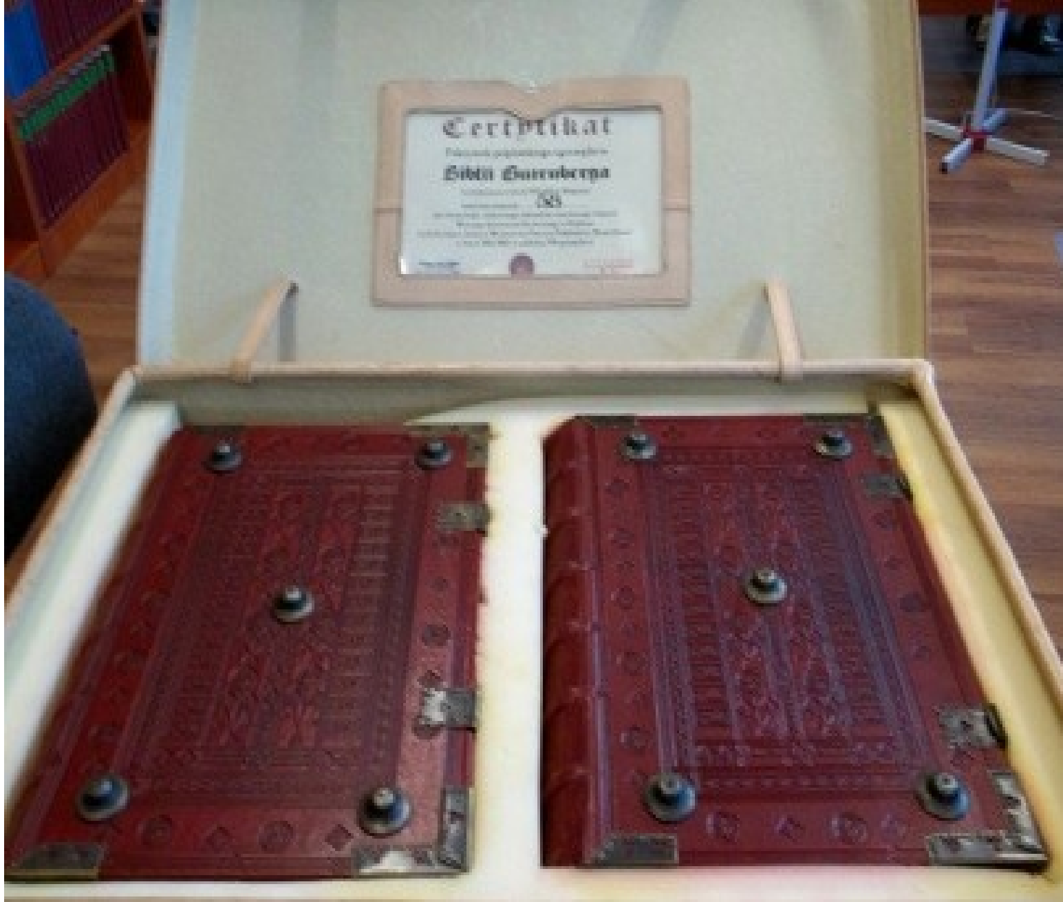
Faksymile Biblii Jana Gutenberga za zbiorów Książnicy Kopernikańskiej. Sygn.: 150407