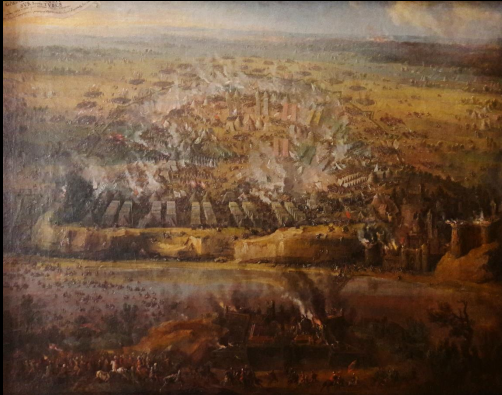
Bitwa pod Chocimiem na obrazie olejnym Pierre-Denisa Martiniego (Martin, 1690-1710)