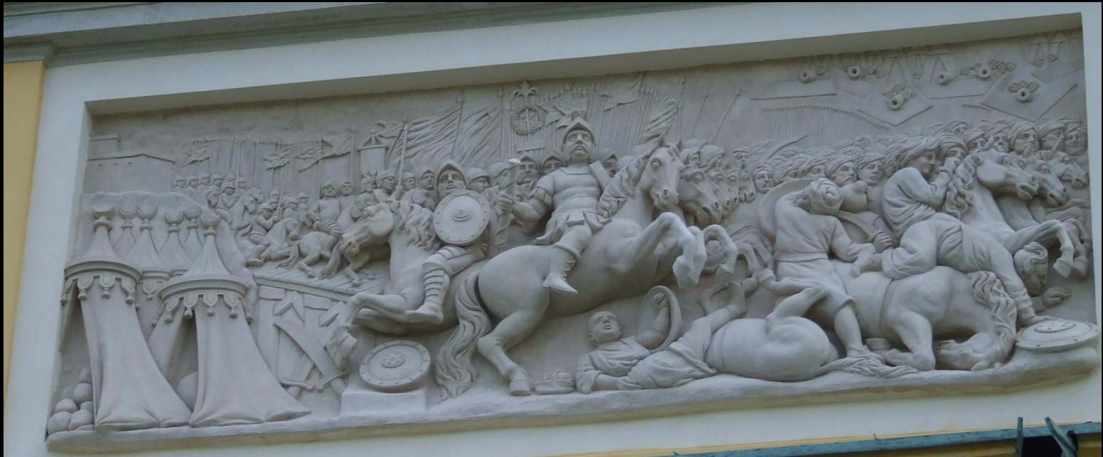
Bitwa pod Chocimiem na reliefie, który znajduje się na budynku Pałacu w Wilanowie (Warszawa)