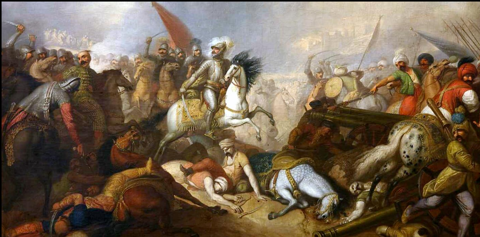
Bitwa pod Chocimiem na obrazie olejnym Franciszka Smuglewicza z końca XVIII w. (Smuglewicz, przed 1797)