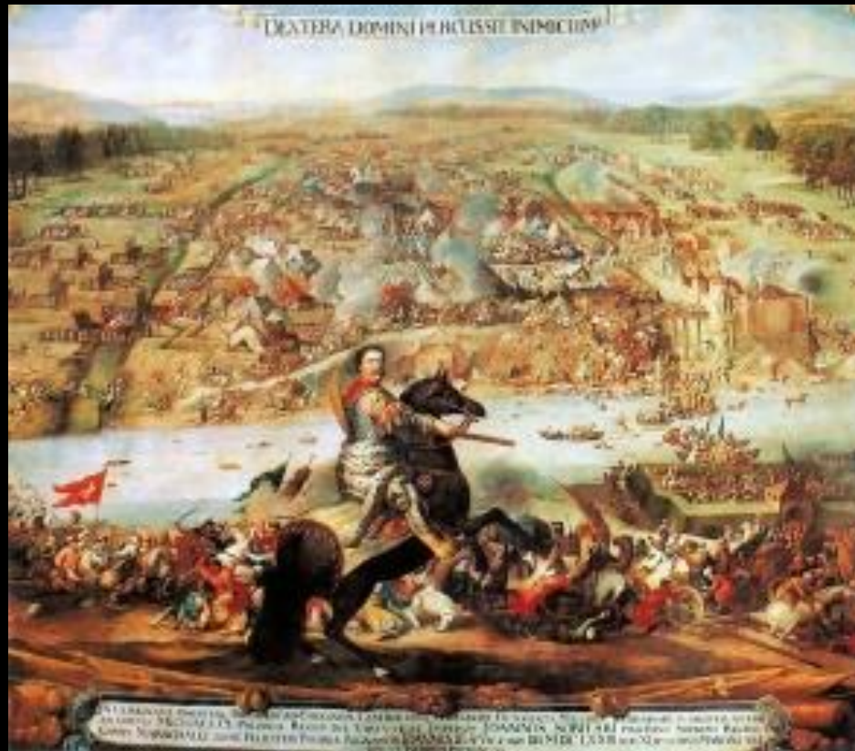
Jan Sobieski na obrazie olejnym przedstawiającym bitwę pod Chocimiem (Stech, & van Kessel the Elder, 1674-1679)