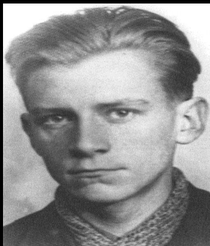
Jan Ronam Bytnar (1921-1943), ps. "Rudy", "Czarny", "Janek", "Krokodyl".