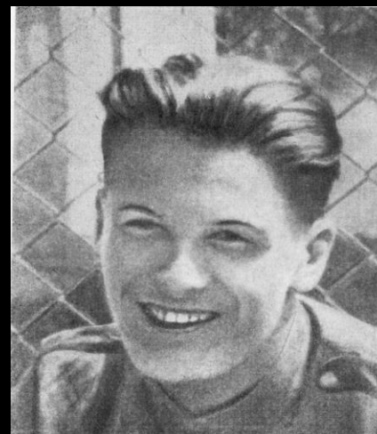
Maciej Aleksy Dawidowski (1920-1943) ps. „Alek”, „Glizda”, „Kopernicki”, „Koziorożec”.